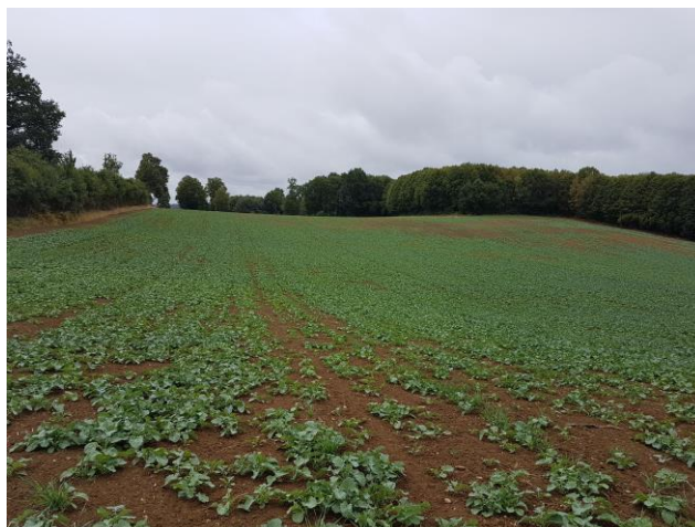
Colza parcelle Nexon

Les colzas sont au stade « germination levée » BBCH05-09 à « 8 feuilles » BBCH18.