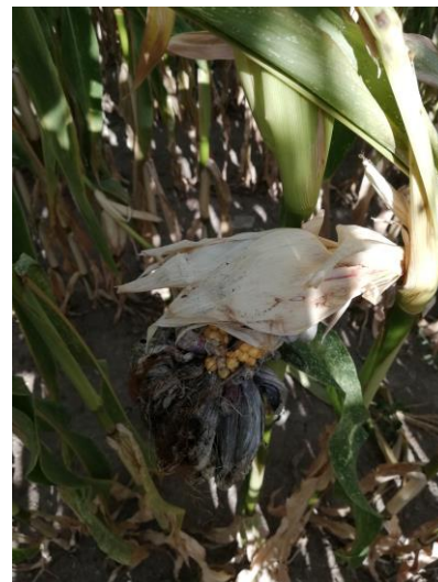
P PENICHOU FREDON Limousin.

A partir de 4 à 5 feuilles du maïs, les plantules sont colonisées et une systémie s'installe dans la plante, le mycélium gagnant les organes de multiplication. Des températures entre 21 et 28°C ainsi qu'une faible humidité du sol (15-25%) favorisent l'infection.