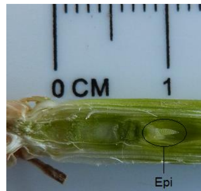
Épi 1 cm

Le stade « épi 1 cm » est atteint lorsque la hauteur ainsi mesurée est en moyenne de 1 cm.