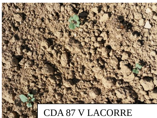
CDA 87 V LACORRE

Les conditions climatiques et les sols très secs, entraînent des levées très hétérogènes... Sur la même parcelle, on voit des colzas à 4 feuilles et des graines qui germent.