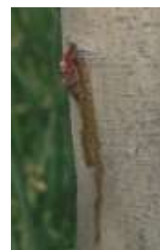
Dégât d'une larve

Les arbres affaiblis par les attaques de Zeuzère sont par la suite fréquemment atteints par d'autres ravageurs xylophages (xylébores, scolytes...).