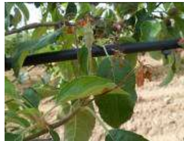
Symptômes de feu bactérien observés sur pommier (Evelyna), le 24 mai 2018