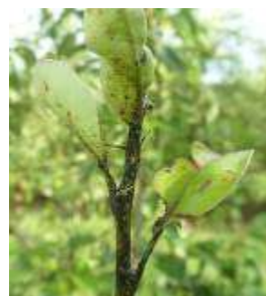
(1) Psylles adultes – (2) dégât sur pousse : miellat et fumagine