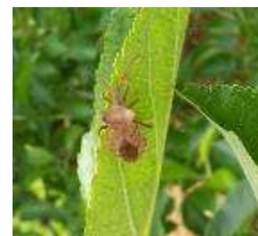
Coreus marginatus

Certaines espèces de punaises, dites punaises phytophages, peuvent causer des dégâts sur pommier. Les fruits piqués sont déformés avec une cuvette et un méplat dans le fond. Ce sont généralement les piqûres sur jeunes fruits, après la nouaison, qui provoquent ces déformations. Plus tard en saison, des punaises peuvent occasionner d'autres dégâts, tels que marbrures, voire décolorations rouges et légère déformation du fruit en crevasse sous la pique. De plus, la formation d'une blessure sur le fruit est une porte d'entrée aux maladies de conservation. Ces dégâts directs sont préjudiciables pour la commercialisation.