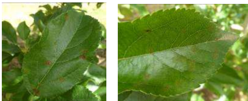
Taches de tavelure primaire (1) et secondaire (2)

On observe des taches de tavelure sur feuilles dans de nombreux vergers traités. Les comptages réalisés en parcelles de référence montrent que 50% de ces parcelles sont contaminées avec des taux d'infestation hétérogène. La fréquence de pousses tavelées est étroitement liée à l'inoculum de la parcelle. Cependant, sur l'ensemble du bassin de production, la pression tavelure en verger est moyenne.