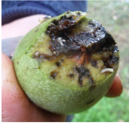
Larves de la mouche du brou et dégâts sur brou

Le nombre de parcelles avec des larves dans le brou des noix (cf. photo ci-dessus) est en augmentation. Le taux d'infestation est très variable d'un verger à un autre. Les dégâts sont souvent plus importants en bordure de parcelle proche d'un point d'eau ou en zone dense (arbres serrés) ou sur des variétés attractives (telle que la variété pollinisatrice Mélanèse).