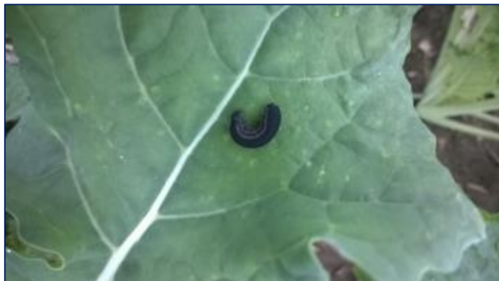
Larve de tenthredè sur feuille

La tenthredè de la rave est un hyménoptère mais présente la caractéristique d'être au stade larvaire une « fausse chenille ». Très vorace, elle ronge généralement le parenchyme des feuilles en ne laissant que les nervures.